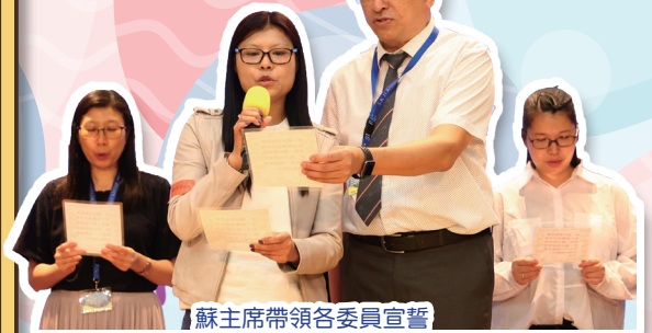
蘇主席帶領各委員宣誓