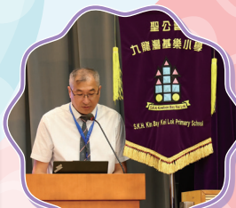
黃副校長帶領祈禱