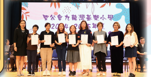
感謝第二十屆家長委員的付出