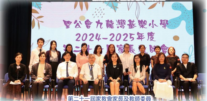
第二十一屆家教會家長及教師委員