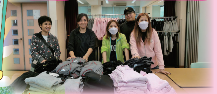
親子活動—— 苔球製作 (23/11/2024)